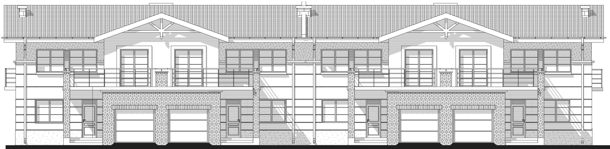
BUDYNEK TYP B - elewacja ogrodowa